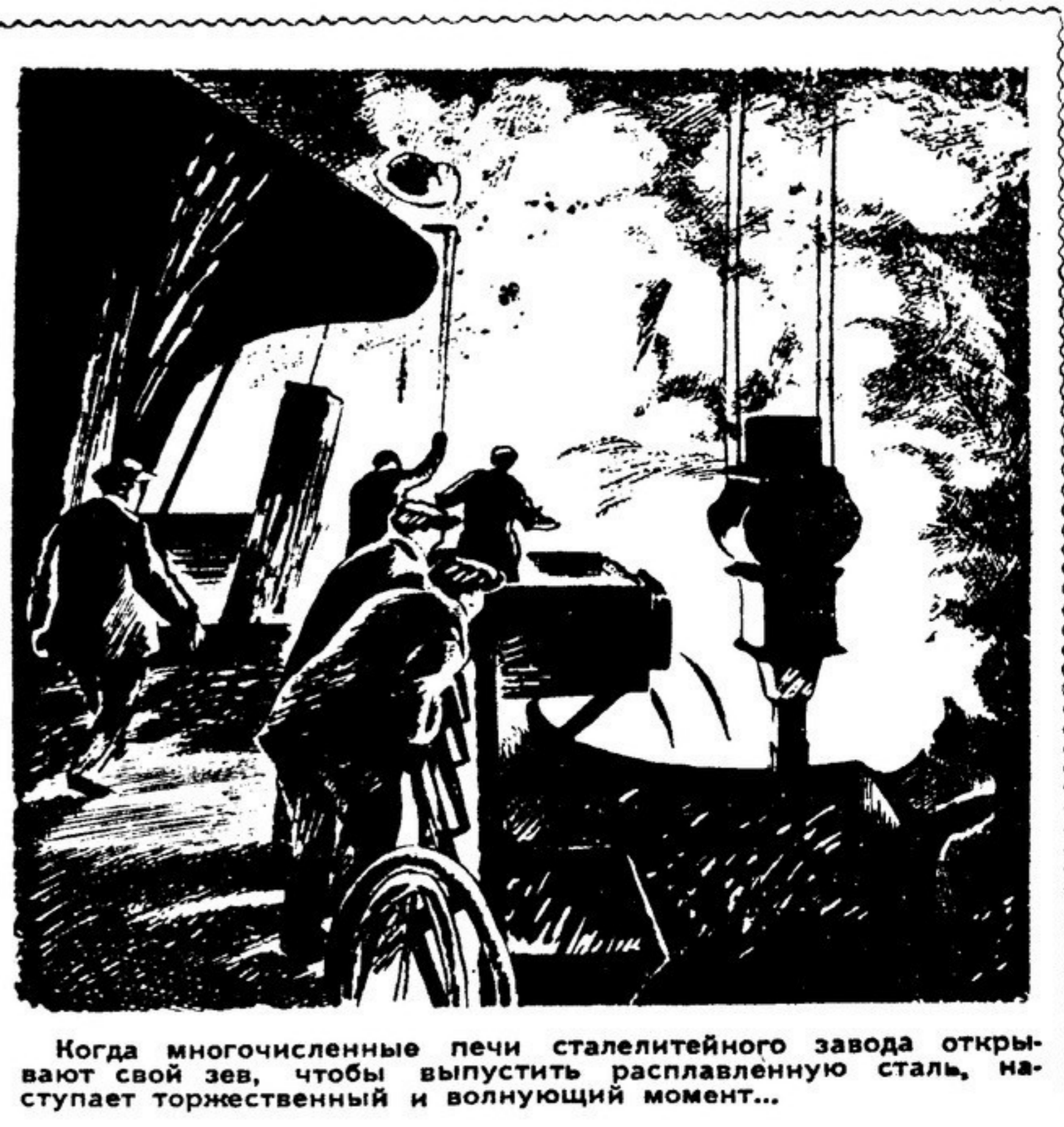
Когда многочисленные печи сталелитейного завода открыли свой зев, чтобы выпустить расплавленную сталь, наступает торжественный и волнующий момент...

Известный прогрессивный датский художник-график Х. Видструп побывал в Китайской Народной Республике.