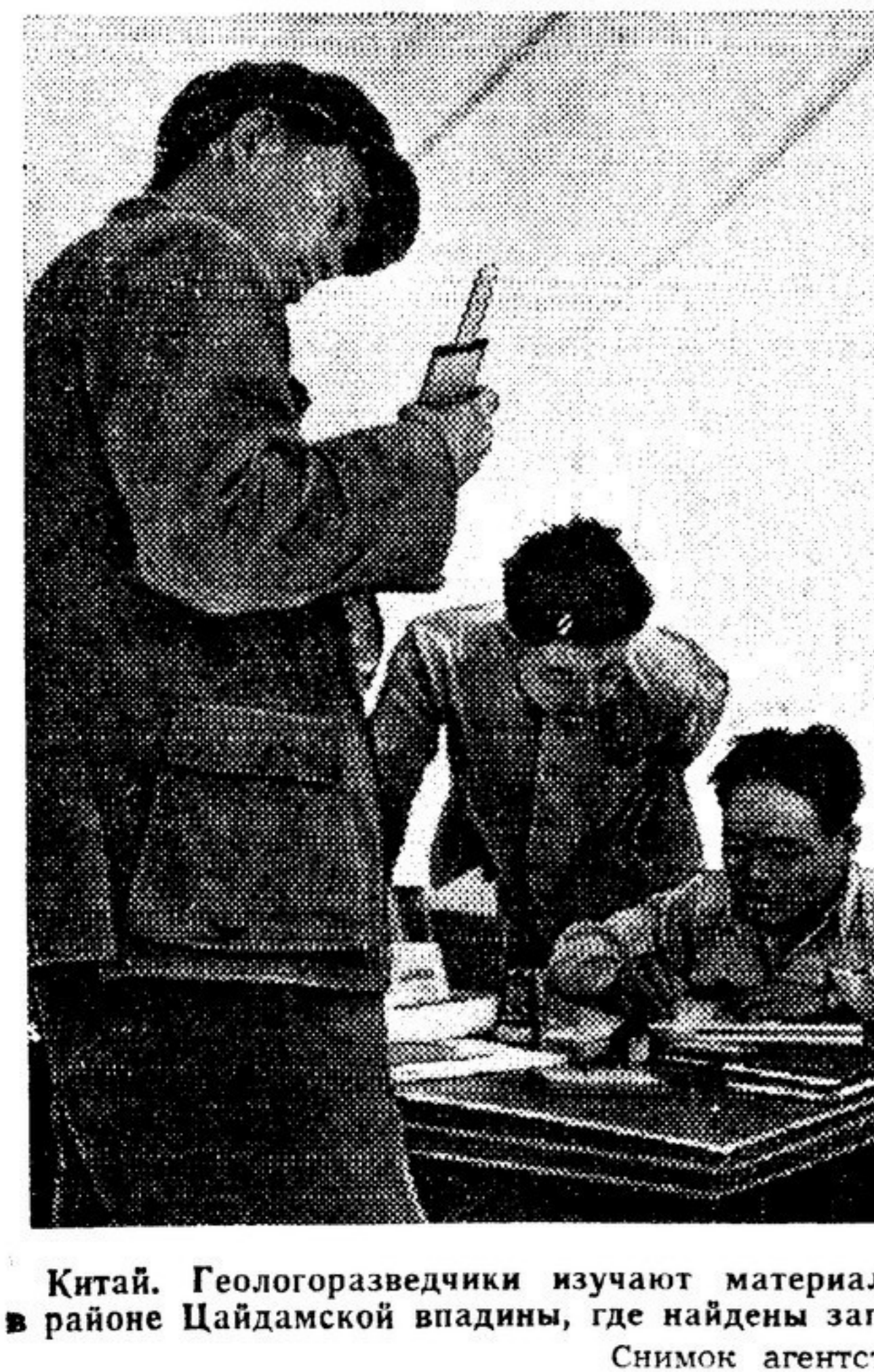
Китай. Геологоразведчики изучают материалы, собранные в районе Цайдамской впадины, где найдены запасы нефти.

медь, свинец и цинка, нефти и множества других полезных ископаемых. Благодаря помощи народа геологи занесли в паспорт страны огромные, неизвестные до этого богатства.